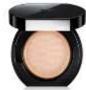
Face glow founbalm