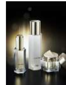
Radiance regenerating line