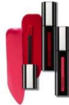
Laque Excellence Tinted (KRW29,000)