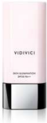
Skin Illumination (KRW52,000)