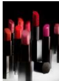
Rouge excellence intense