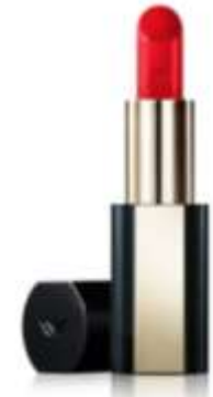
Rouge Excellence (KRW38,000)