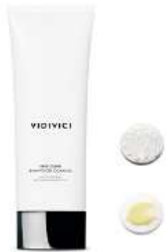
Face Clear Balm to Gel Cleanser (KRW38,000)