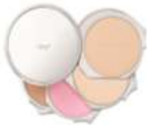
Signature small face case