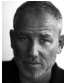
by Fabien Baron