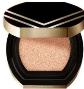
Perfect Essence Cushion SPF50+ PA+++/3 shades (KRW56,000)