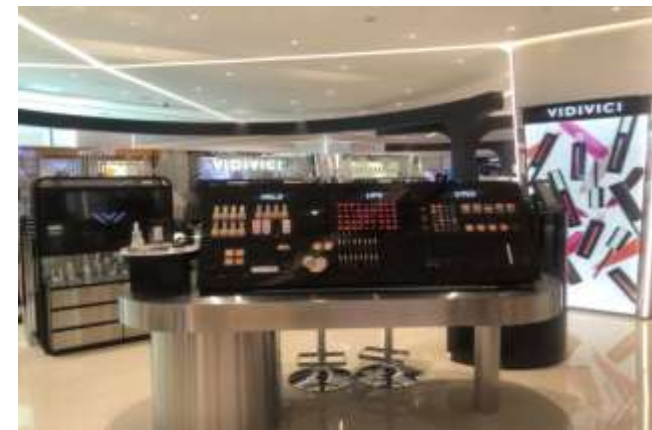
SSG MAIN/SHILLA / Hanwha Galleria