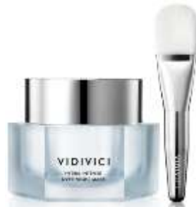
Hydra Intense Overnight Mask (KRW65,000)