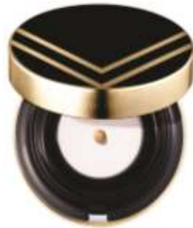
Perfect V Fit Cushion (NEW) SPF50+PA+++/3shades (KRW58,000)